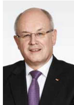
Volker Kauder MdB Vorsitzender der CDU/CSU-Bundestagsfraktion