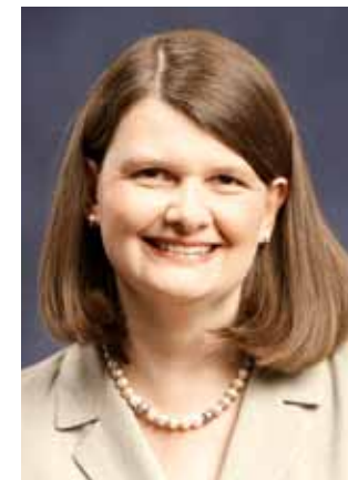
Dr. Maria Flachsbarth MdB Beauftragte für Kirchen und Religionsgemeinschaften der CDU/CSU-Bundestagsfraktion

Das große Interesse, auf das die Frage nach der Bedeutung des christlichen Menschenbildes und der ethischen Grundsätze aus dem christlich-jüdischen Erbe in unserer Politik stößt, zeigt uns, dass wir damit auf dem richtigen Weg sind. Für uns Christdemokraten und Christsoziale ist das „C“ im Parteinamen eine stete Selbstverpflichtung – das gilt auch und besonders mit Blick auf die Soziale Marktwirtschaft im nationalen Binnenraum wie auf globaler Ebene.