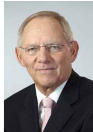
Dr. Wolfgang Schäuble MdB Bundesminister der Finanzen

National wie global ergibt sich deshalb dieselbe Schwierigkeit: Wie lassen sich politische, wirtschaftliche und soziale Überlegungen, die auf dem christlichen Menschenbild beruhen, in eine Konsensbildung