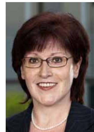
Ingrid Fischbach MdB

Stellvertretende Vorsitzende der CDU/CSU- Bundestagsfraktion