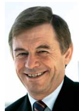
Bartholomäus Kalb MdB Vorsitzender des Arbeitskreises Finanzen und Haushalt der CSU- Landesgruppe

Doch die Gefahr der Sozialen Marktwirtschaft besteht darin, dass durch immer mehr Sozialleistungen die Verantwortung der Bürger, der Gemeinschaft etwas zurückzugeben, auf der Strecke bleibt. Dass die Gesellschaft für den Einzelnen aufkommt, wird als „Selbstverständlichkeit“ gesehen; dass das Individuum auch für die Gesellschaft da ist, wird ignoriert. Finanzielle Hilfeleistungen alleine reichen nicht aus, um ein soziales und moralisches Bewusstsein des