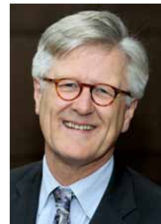
Prof. Dr. Heinrich Bedford-Strohm Professor für Systematische Theologie, ab Nov. 2011 Landesbischof der Evangelisch-Lutherischen Landeskirche in Bayern

Wer sich fragt, von welchen Orten der Gesellschaft die notwendige Orientierung in diesen Fragen eigentlich kommen soll und wo die damit verbundenen Orientierungsfragen gründlich reflektiert werden, wird gar nicht so schnell fündig werden. In der Politik oder der Wirtschaft wird er auf ziemlich viel Hilflosigkeit im Umgang mit ethischen Fragen stoßen. Sie werden eher verdrängt. Bei den Philosophen wird man, wenn man lange genug sucht, einiges finden, was bei der Klärung ethischer Grundfragen hilft. Aber wer findet schon den Weg in die Universitäten oder vertieft sich in philosophische Literatur? Wer nach einer Institution sucht, bei der diese Fragen einen festen Ort in der Öffentlichkeit haben und bei der auch Antworten erwartet werden dürfen, der wird am Ende doch wieder auf die Kirchen stoßen. Sie haben in der modernen pluralistischen Gesellschaft ihr Deutungsmonopol verloren. Die Leute suchen sich ihre Weltanschauung heute aus vielen Quellen zusammen. Viele